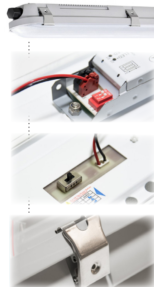
zaščita pred vandalizmom